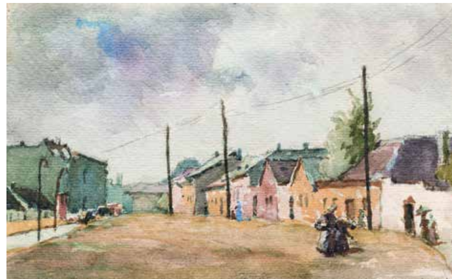
Kássa Gábor: Majláth utca, akvarell (1949) forrás: Óbudai Múzeum

(akkor Sztálin híd), ugyanebben az évben csatolták a kerülethez Békásmegyert. Az 1956-os forradalom eseményei nem kerülték el Óbudát, a fegyveres harcok leginkább a Kiscelli kastély környékén zajlottak.