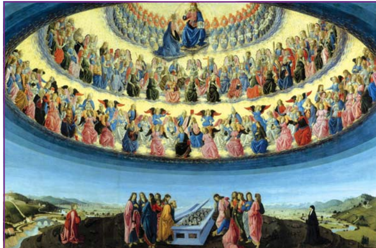
Francesco Botticini: Mária mennybevétele

Magyarországon Szent István király avatja ünnepé augusztus 15-ét. Az államalapító király élete vége felé erre a napra hívta össze Fehérvárra a királyi tanácsot, tartott törvénykezést, és ajánlotta fel az országot Szűz Máriának. A maga nemében páratlan felajánlás nyomán a közjogban is érvényesült a magyar történelem folyamán a Regnum Marianum eszme, mely szerint Magyarország Mária országa. Az Árpád-korban Szűz Mária lett a magyarok legfőbb oltalma, templomok, székesegyházak, mo-