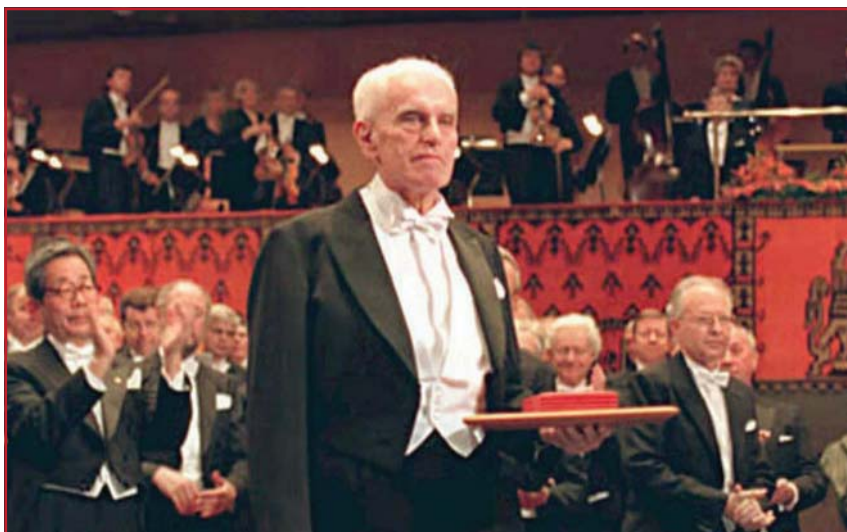
1994-ben, Stockholmban a Nobel-díj átvételekor

- Néhány éve egy budai antikváriumban kerestem Nobel-díjasokról szóló magyar nyelvű könyvet. Ahogy kiejtettem John Nash-nek, az amerikai „csodálatos elmének” a nevét, máris hozta a tulajdonos a róla szóló magyar nyelvű könyvet. Amikor Harsányi János nevét mondtam, tágra nyitotta a szemét: „Hát ő meg kicsoda?” – kérdezte. Válaszomon igen meg-