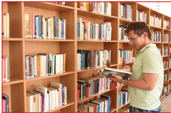
Folytatás az 1. oldalról

Az Óbudai Platán Könyvtár idén nyáron nyújtotta be először pályázatát, melyet elismert szakmai bizottság értékelt. A bizottság javaslata alapján a Minősített Könyvtár címet Fekete Péter kultúráért felelős államtitkár adományozza az Óbudai Platán Könyvtár számára, amit 5 évig birtokol-