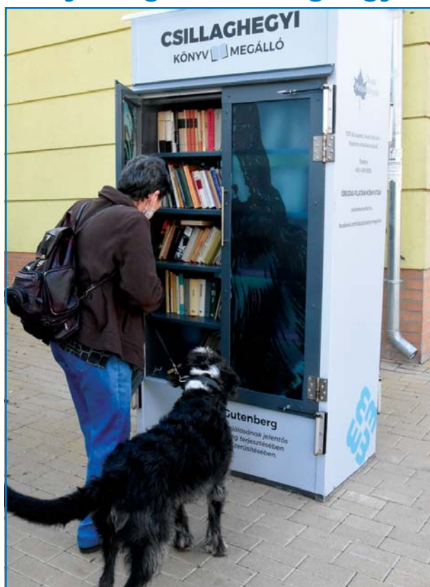
Sok könyvbarát örül a közelmúltban átadott csillaghegyi KönyvMegállóknak a Mátyás király úton