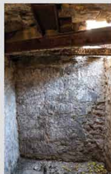
A pince tartószerkezeti megoldásai és a beszakadt födém