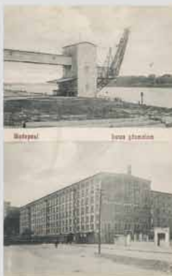
Lujza gőzmalom a Lujza (Kolosy) téren, 1911-ben feladott képeslapon

A kivitelezővel újra tárgyalás alatt vannak a munkák ütemezései, hogy a felmerült műszaki problémák minél kevesebb csúszást okozzanak. Az előre nem látott komplikációkért és az így okozott kellemetlenségekért további türelmüket és megértésüket kérjük.