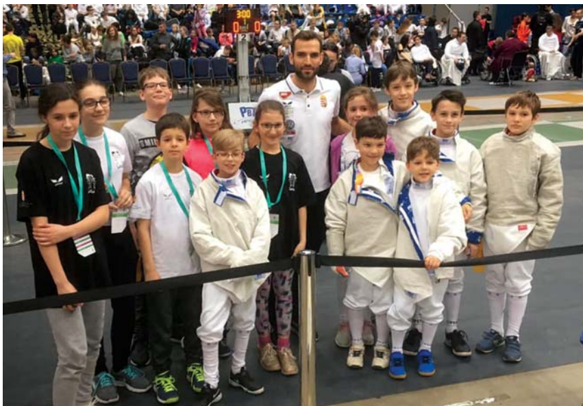
Szilágyi Áron kétszeres olimpiai, világ- és Európa-bajnok kardvívó a vívópalántákkal

Az A kategóriában is jutott Óbudának. De di Luca merész vívással, (1400 nevezés!) már érem milyen csodás érem! Bar-kemény csatában hányta