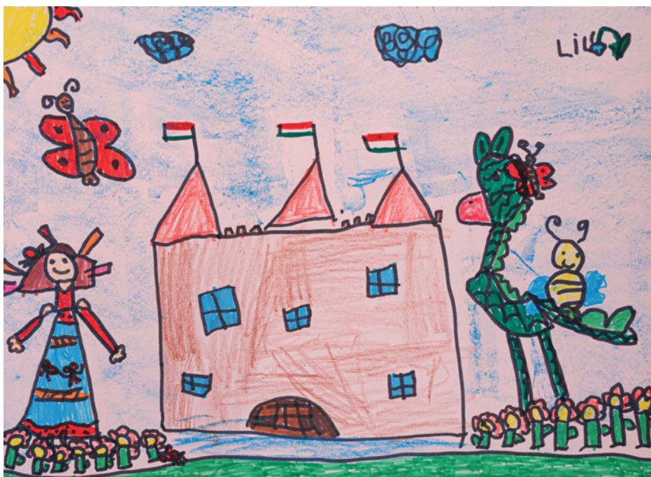
Szigeti Lili Cseresznyevirág Művészeti Óvoda