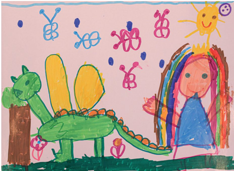
Pusztai Róza Cseresznyevirág Művészeti Óvoda