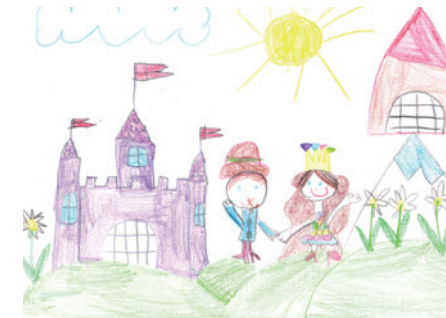
Varga Kornélia - Óbudai Százszorszép Óvoda