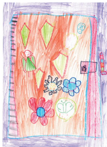
Aczél Vivien Cseresznyevirág Művészeti Óvoda

Fülébe jutott ez a Százszorszép palotában élő Laura hercegisasszony-nak és az apjának is. Az öreg király egy pillanatig sem tétlenkedett – tudta jól, itt már csak Sárkányúzó Milos segíthet! Na de hogyan is értesítsék őt? Ki vigye hírét a bajnak? Törte a fejét a király, törte, de bizony nem jutott eszébe semmi okos gondolat.