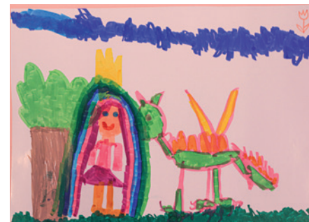
Rajz Emma Magdolna - Cseresznyevirág Művészeti Óvoda