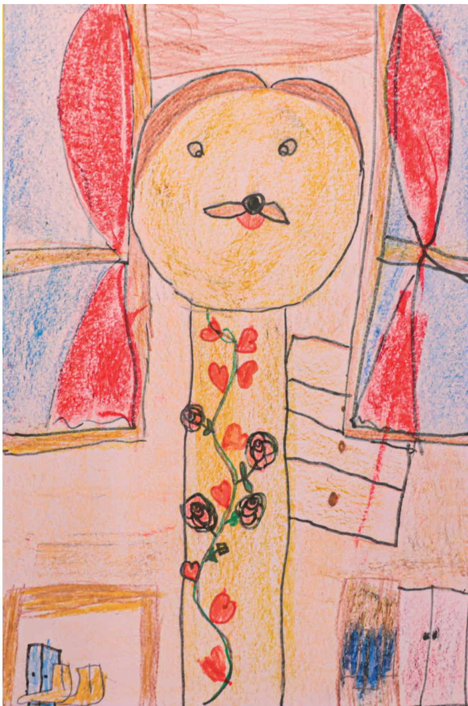
Badacsonyi Viola Cseresznyevirág Művészeti Óvoda

fejét, aztán egyre laposabbakat pislogott. Dédi csettintett egyet, és visszarepítette a barlangjába. Csalikó már a barlang szájánál várta, és alatókból font puha takaróra fektette, majd az állatmesékből kovácsolt rácsra kattintotta az ittavégfusselvéle-lakatot.