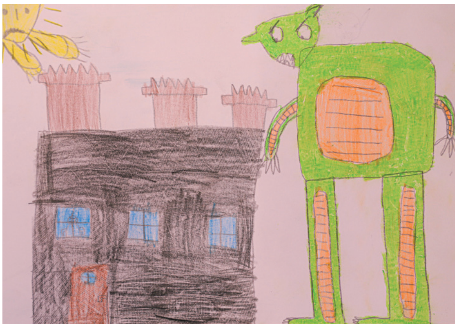
Lukács Zakariás Cseresznyevirág Művészeti Óvoda