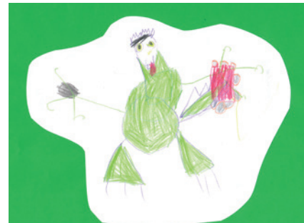
Csatári Adél - Óbudai Hétpettyes Óvoda