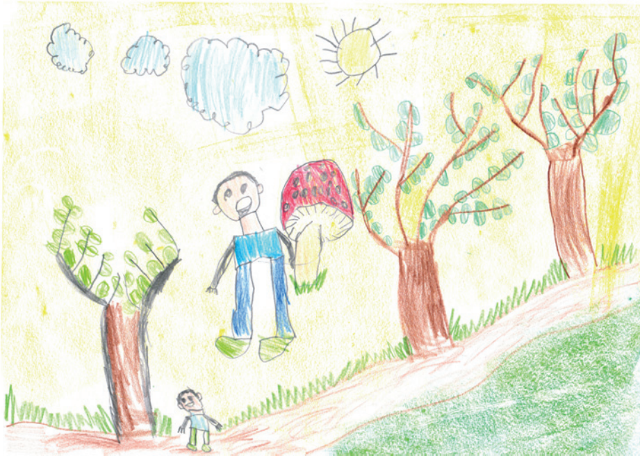
Berki Bence Cseresznyevirág Művészeti Óvoda