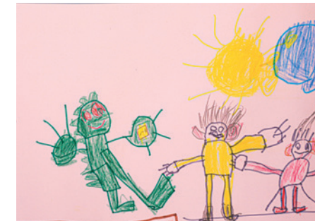
Dalloul Ádám - Cseresznyevirág Művészeti Óvoda