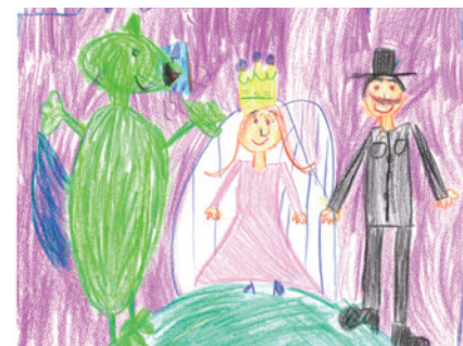
Gerencsér Izabella - Óbudai Százszorszép Óvoda