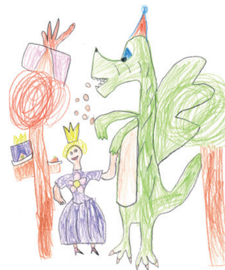
Szűcs Zoé - Óbudai Meseerdő Óvoda