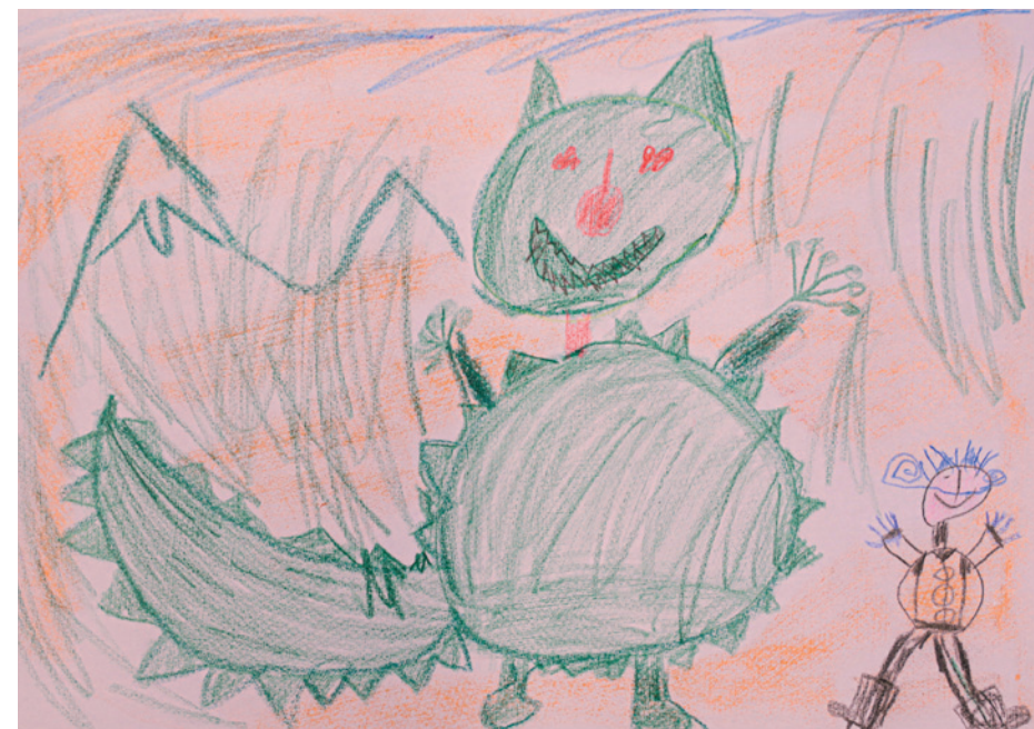
Ónozó Márton Cseresznyevirág Művészeti Óvoda

Reggel jó korán felébredtek, s már indultak is. Hát, ahogy így mentek, mentek, a Mocsárosdűlő közepén szembetalálták magukat a nagy Rontó-bontó Sárkánnyal. A sárkány – feje alatt a bőrkötésű könyvvel – édesen szunyókált még.