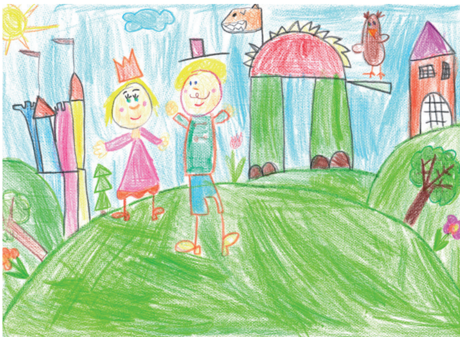
Kammerer Lili Óbudai Százszorszép Óvoda

A mese Óbuda-Békásmegyer Önkormányzat óvodai dolgozóknak szóló, 2021. évi meseíró pályázatának első helyezettje lett.