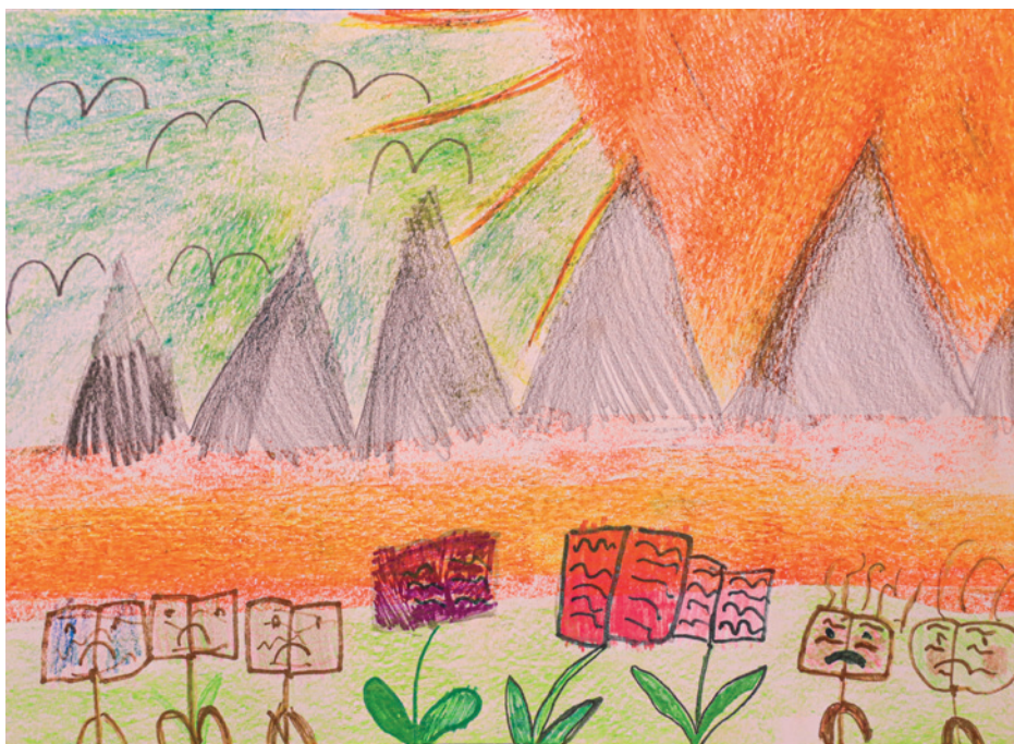
Vass Boglárka Cseresznyevirág Művészeti Óvoda