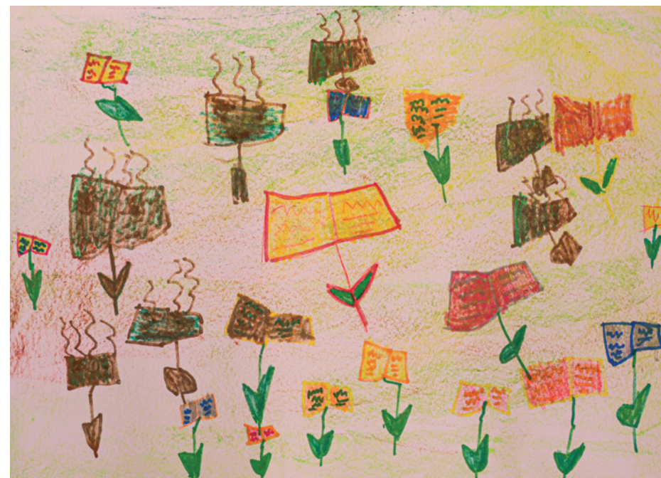
Gallai Georgina Titanilla Cseresznyevirág Művészeti Óvoda

– Tudod, Jancsikám, ezek a nagy szeműek itt a vigyorgócok, ők a mesék kertészei, ők nevelgetik a mesepalántákat. Borzmasanc pedig egy medve, csak akkora, mint egy trolibusz. Jámbor, csak szeret megszökni. Csalikó őrszi, mert ha kiszabadul a barlangból, akkor lelegeli az összes