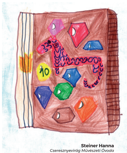
Steiner Hanna Cseresznyevirág Művészeti Óvoda

– Ez kell nekem! Ilyen gyönyörűség! – bömbölte boldogan, azzal a hóna alá csapta, és már indult is vele hazafelé.