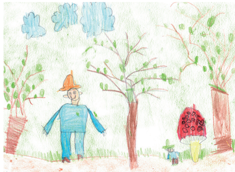
Kovács Balázs Áron Cseresznyevirág Művészeti Óvoda

Mentek, mendegéltek, mikor egyszer csak sírást hallottak. A közeli tisz-táson egy óriás üldögélt, és hatalmas könnyekkel bömbölt. Mufurc rög-vest Bertold mögé bújt ijedtében, aki viszont bátran megszólította az óriást: