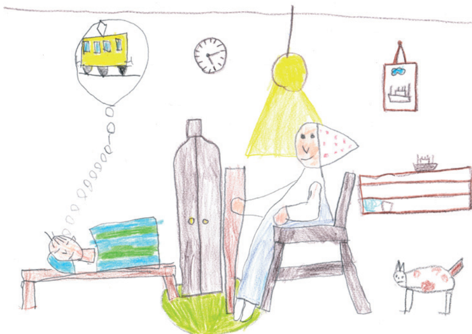
Carabas Miron Cseresznyevirág Művészeti Óvoda