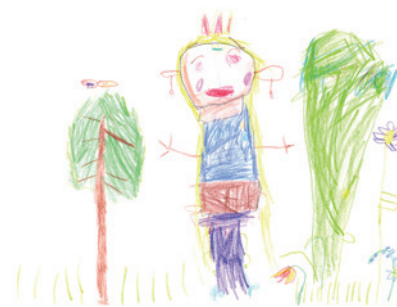
Tisza Luca - Óbudai Meseerdő Óvoda