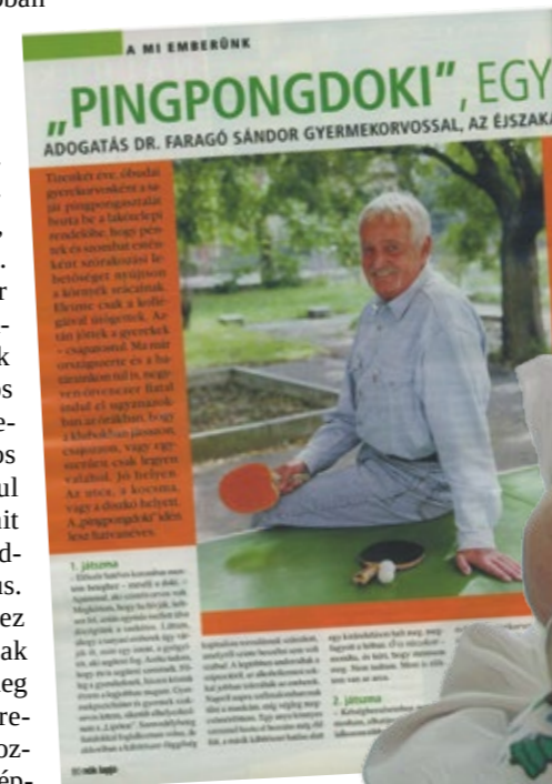
Faragó doktor a Nők Lapjában

letet, amelynek célja volt, hogy a hátrányos helyzetű fiatalok ne az utcán csellegjenek.