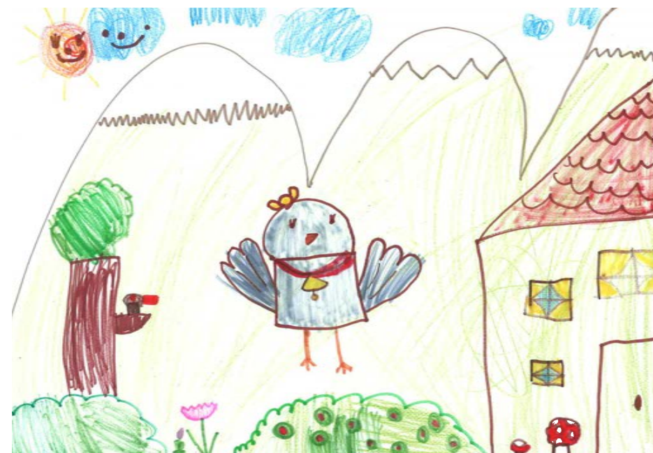
Turai-Kiss Léna - Óbudai Százszorszép Óvoda