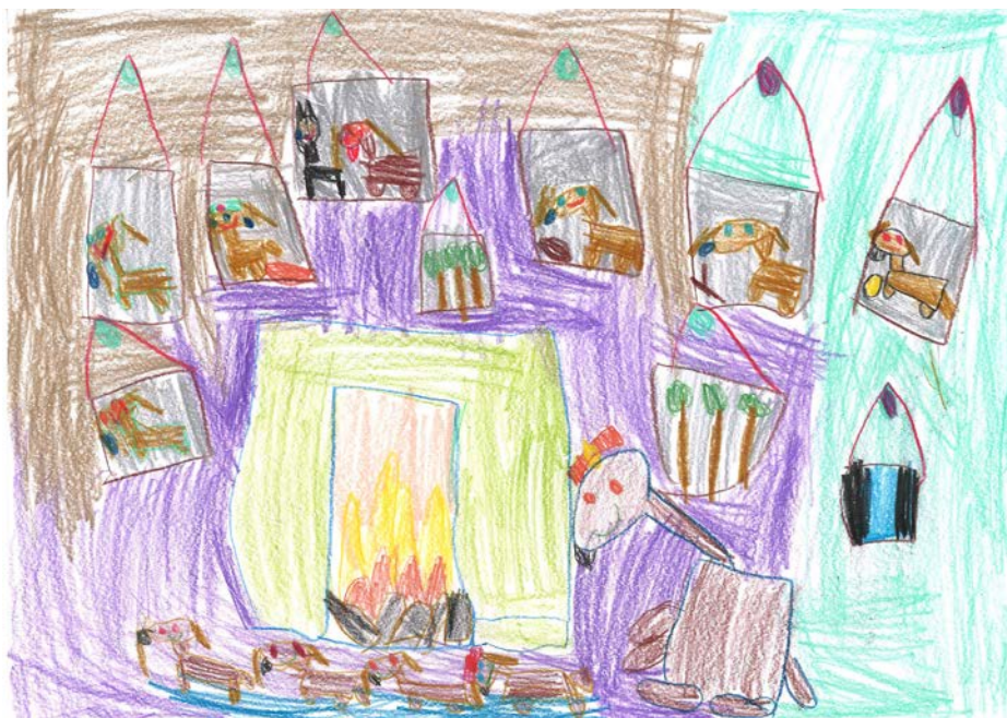
Kovács-Kárpáti Tamara - Óbudai Meseerdő Óvoda