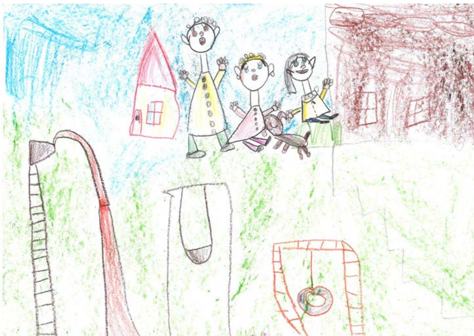
Kocsis Boglárka - Óbudai Meseerdő Óvoda