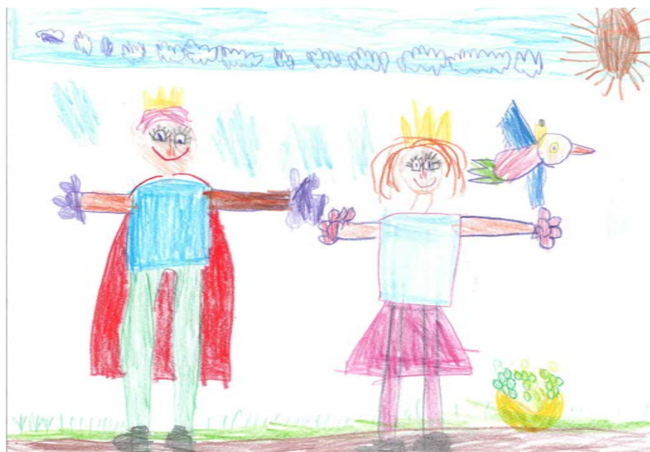
Ceszlai Zétény - Ágoston Művészeti Óvoda