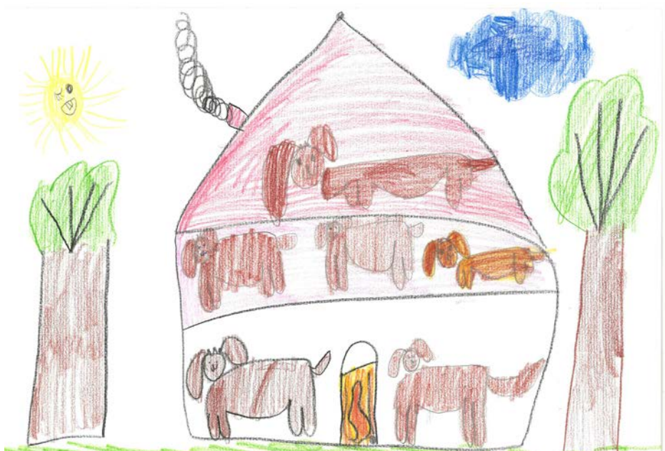
Zsíros Boglárka - Óbudai Meseerdő Óvoda