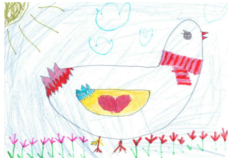
Bojtos Bella - Óbudai Százszorszép Óvoda

A zsűri döntése értelmében 2023-ban ez a mese lett Óbuda-Békásmegyer Önkormányzat meseíró pályázatának második helyezettje.