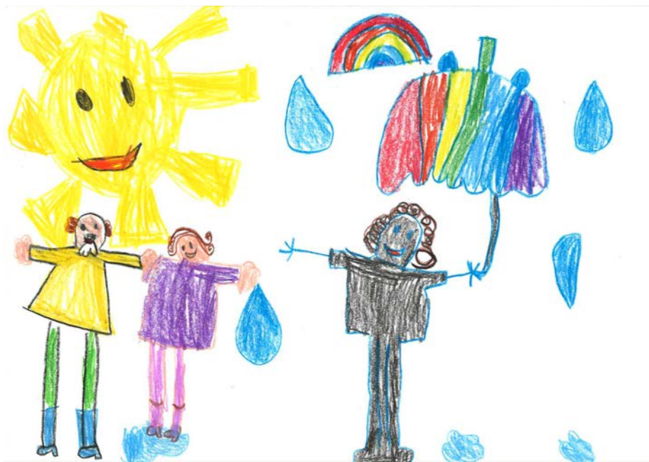
Kecskeméti Aliz - Óbudai Gyermekvilág Óvoda