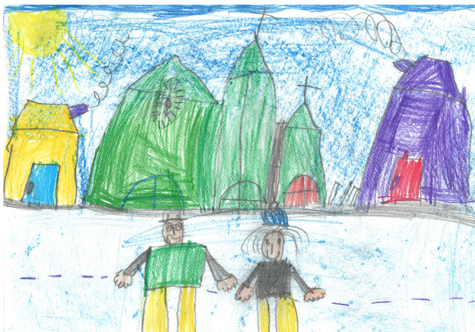
Hosszú Gergő - Cseresznyevirág Művészeti Óvoda